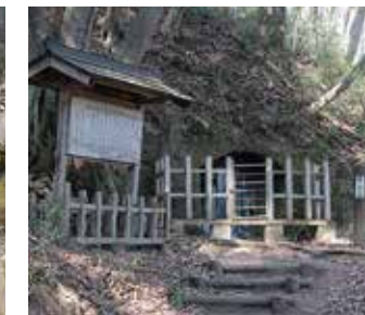
【国史跡】唐御所横穴

常設展示では、縄文時代から奈良・平安時代にわたり5つのテーマを取り上げ、実物資料とともに復元模型や映像等を用い、那須地域の歴史を紹介しています。