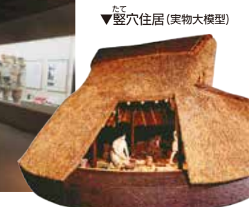
たて 竪穴住居(実物大模型)