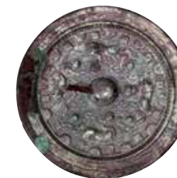
がもんたいしじゅうきょう 画文帯四獣鏡（駒形塚古墳）