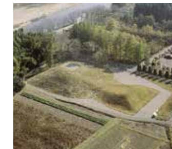
【国史跡】那須八幡塚古墳（北上空から）

「なす風土記の丘」周辺は、栃木県の北東部を流れる那珂川と箒川の合流点を中心に、南北約5kmのエリアに那須地域の古代文化の特性をあらわす史跡が数多くあります。