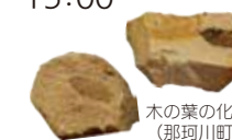
木の葉の化石 (那珂川町)