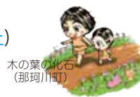
木の葉の化石 (那珂川町)