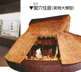
たて ▼竪穴住居（実物大模型）