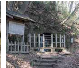
【国史跡】唐御所横穴

常設展示では、縄文時代から奈良・平安時代にわたり5つのテーマを取り上げ、実物資料とともに復元模型や映像等を用い、那須地域の歴史を紹介しています。